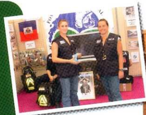
Foire Exposition des Côtes d'Armor