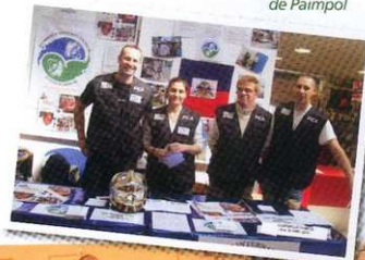
Stand de collecte à l'hypermarché de Paimpol

Cette opération va être renouvelée au cours de l'année 2011.