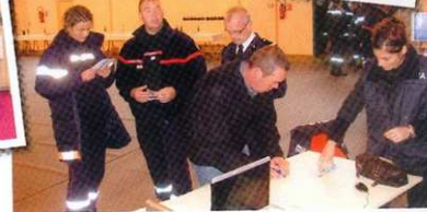
Congrès départemental des Sapeurs-Pompiers à Pontriou