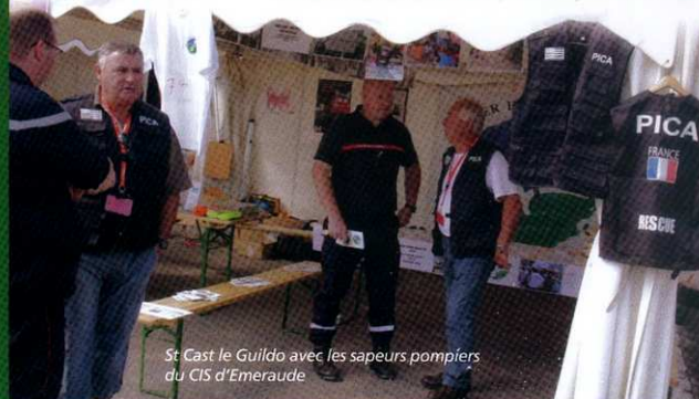
St Cast le Guildo avec les sapeurs pompiers du CIS d'Emeraude